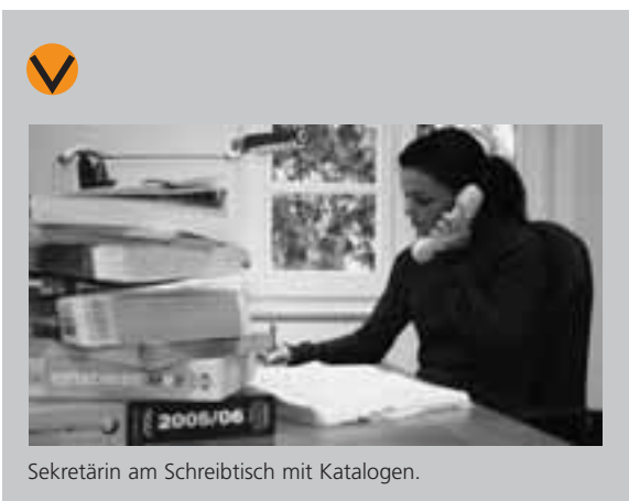
Sekretärin am Schreibtisch mit Katalogen.